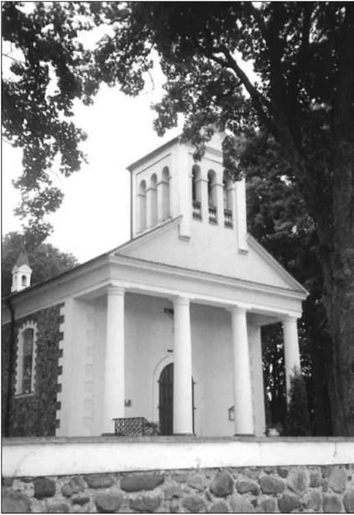
Na zdjęciu: Eklektyczny kościół rzymskokatolicki pw. św. Ludwika z 1818 roku w Olicie.

1,4 tys. mieszkańców. Prawa miejskie magdeburskie uzyskało od króla Zygmunta Augusta w 1569 roku. Najcenniejszym zabytkiem jest wczesnobarokowy kościół pw. Wniebowzięcia NMP, ufundowany przez Jagiełłę, później przebudowany, a niedawno odnowiony. Wnętrze kryje trzy otoczone kultem obrazy (w tym XVI-wieczną Madonnę z Merezca) i pięć barokowych ołtarzy. Ciekawe są dwa kamienne słupy z 1579 r. wyznaczające ówczesne granice miasta. XIX-wieczną cerkiew prawosławną zamieniono w muzeum regionalne.