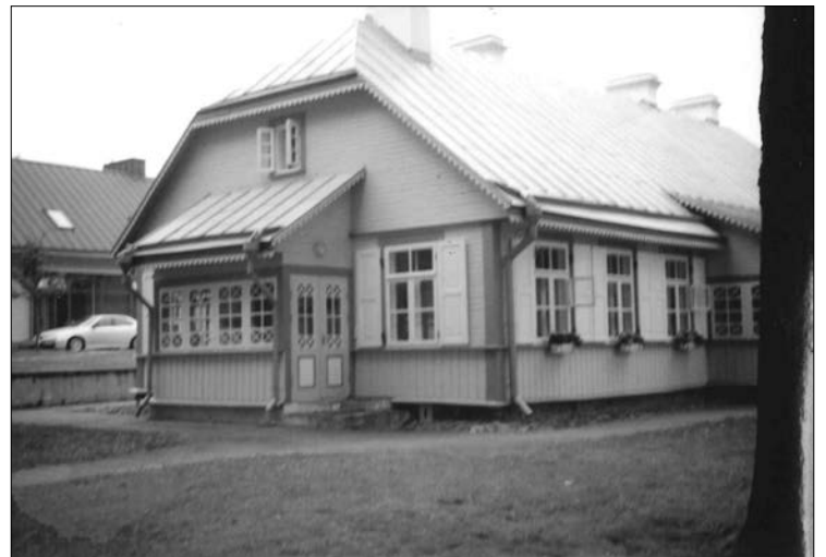
Na zdjęciu: Muzeum Sztuki Sakralnej (Birsztany)