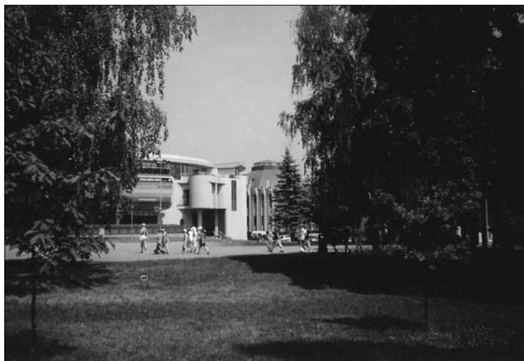
Na zdjęciu: Nowa zabudowa Muzeum Sztuki Sakralnej (Birstono Sakralinis Muziejus) przy ul. Birutės gatvė 10.

mknienia ?! Patrz pn 08.07.25 Jeszcze Kapciamiestis /Kapiowio/ z pomalowanym na kolor złoty-brr !/ pomnikiem Emilii Plater, kopiec w Merezcy-„cudowny rejs stateczkiem po Niemnie/Zenek z wiadomych powodów zostawił dokumenty/„gagatliwy Dyrektor Szkoły w Jaszunach,Wilno wg.nie do „zagiecia” przewodniczki Jasi-„wzgorze Gedymina i opiekun Polaków ks.Jozef Obremski w Mejszagole,Kowno,Barglow i ...do Domu. Tak widziałem trasę jako kierowca,jadąc z „duższą na ramieniu”,gdz w każdej chwili mogło się „rozlecieć”kolo wirnika chłodnicy.