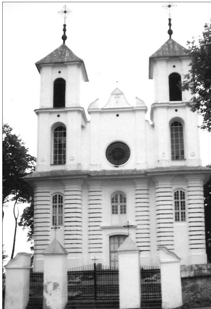
Na zdjęciu: Punie (Punia) Nad Niemnem w Dżukiji. Fronton barokowo-klasycystycznego kościoła rzymskokatolickiego pw. św. Apostoła Jakuba z 1863 roku. Fot. Tadeusz Borysewicz

Miasto Merezcz (Merkinė) kilkaset lat temu było jednym z większych na Litwie, dziś liczy